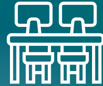
PUESTOS DE TRABAJO