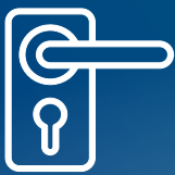
TIRADORES Y POMOS