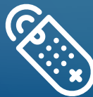
MANDOS A DISTANCIA, TELÉFONOS, EQUIPOS INFORMÁTICOS, TPV