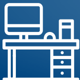
MESAS, SILLAS, EQUIPOS DE OFICINA Y TECLADOS