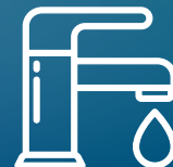
PUERTAS, GRIFOS Y DISPENSADORES