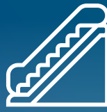
PASAMANOS, BARANDILLAS, PUNTOS DE APOYO