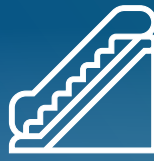
PASAMANOS, BARANDILLAS, PUNTOS DE APOYO